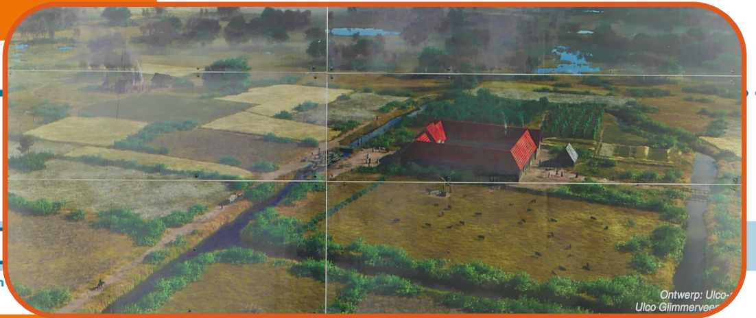
Ontwerp: Ulco- Ulco Glimmerveen